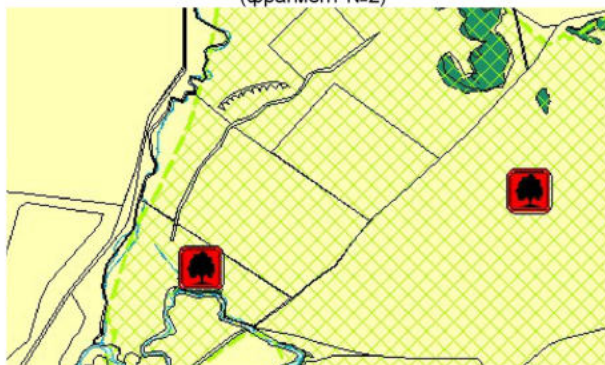
Карта функциональных зон (фрагмент №2)